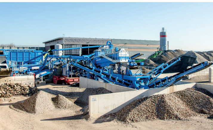
👁 Die Nassklassierungsanlage in Kirchheim